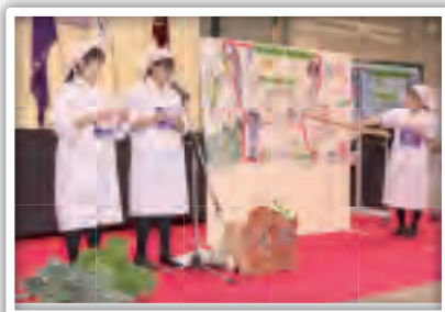
プレゼンテーション風景