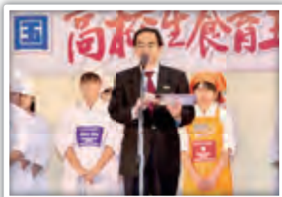
福井県知事 西川一誠